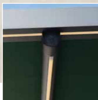
Eclairage LED dans les poteaux, les profils de toile et le poutre de soutien

Cette surface égale et le degré d'inclinaison minimal de 15 cm/m* permet à chaque goutte de pluie de glisser rapidement vers la gouttière invisible intégrée dans le profil frontal.