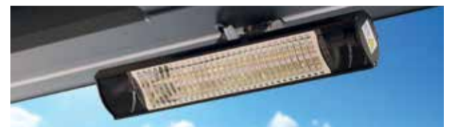
Chauffage 2000 Watt