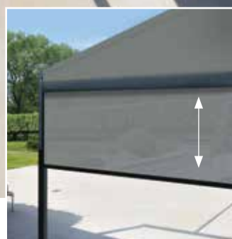
Vous pouvez fermer complètement le B-128 avec une toile fixe et un screen ZIP.